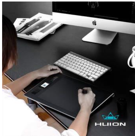
Rajah 3: Contoh 'writing pad'

Demi pelajar-pelajar yang dahagakan ilmu, pensyarah tidak boleh kedekut dengan wang. Pelaburan yang berbaloi demi kesinambungan penyampaian ilmu perlu dibuat. Maka, pesanan untuk sebuah 'writing pad' dibuat dalam tempoh PKP walaupun ia mengambil masa dua minggu untuk tiba.