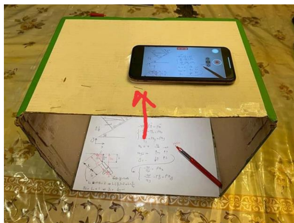
Rajah 2: Kotak dilubangkan pada tanda anak panah (Western Cape Education Department, 2020)

Sedikit demi sedikit kemajuan dalam ODL dicari dan digunapakai. Apabila kaedah melekatkan kertas di dinding menjadi agak sukar kerana video mungkin bergoyang, satu inovasi dijumpai.